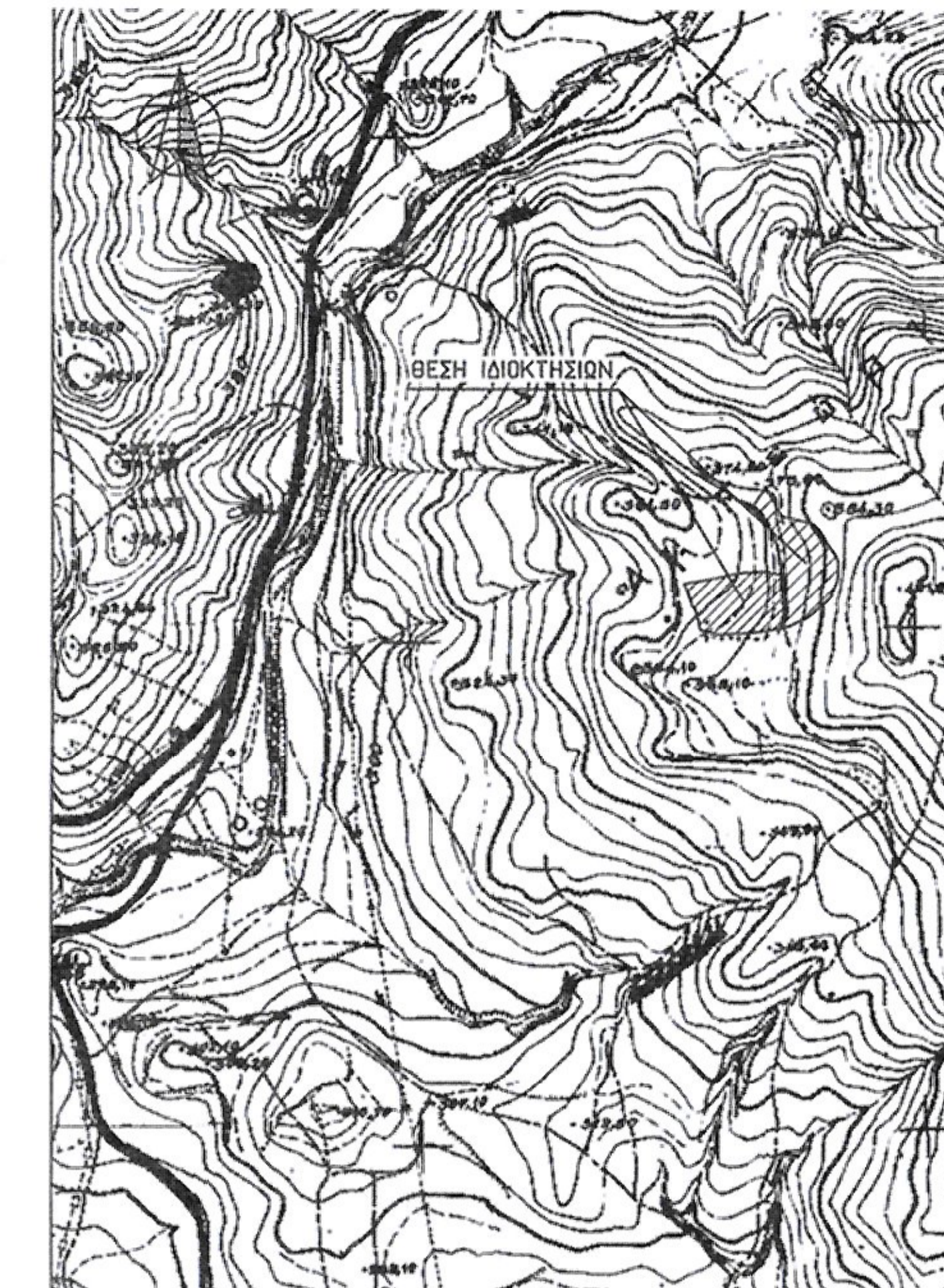
ΑΠΟΣΠΑΣΜΑ ΧΑΡΤΟΥ Γ.Υ.Σ. κλίμακα 1:5000