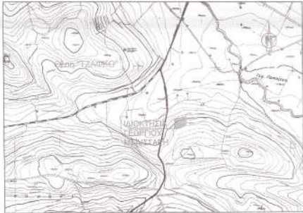
ΑΠΟΣΠΑΣΜΑ ΑΠΟ ΚΤΗΜΑΤΟΛΟΓΙΟ