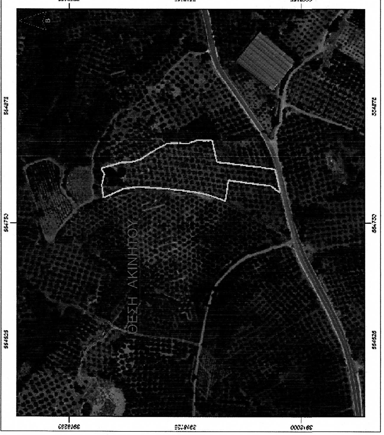
ΑΠΟΣΠΑΣΜΑ ΟΡΘΟΦΩΤΟΧΑΡΤΗ ΑΠΟ ΚΤΗΜΑΤΟΛΟΓΟ Α.Ε.