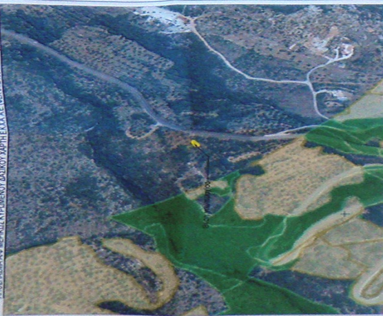
ΑΤΟΥΤΑΜΑ ΕΥΡΥΤΕΡΗΣ ΠΕΡΙΟΧΗΣ ΜΕΤΕΩΡΟΥ ΕΚΧ.310.08-02-2010 ΚΑΜ 1:5000