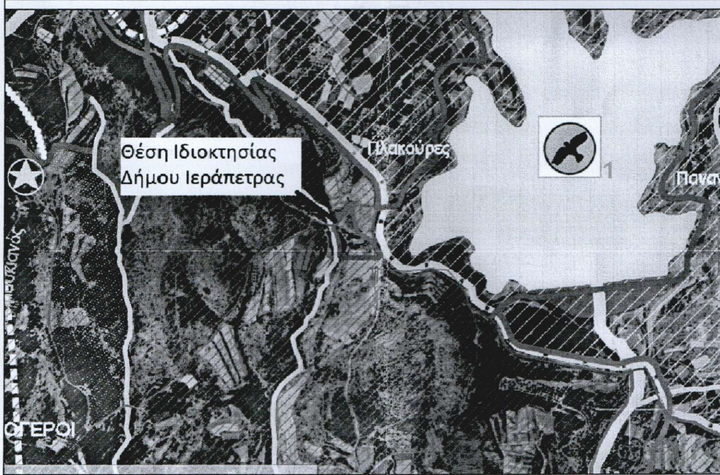
ΕΙΚΟΝΑ ΑΠΟ ΤΟ Γ.Π.Σ ΙΕΡΑΠΕΤΡΑΣ