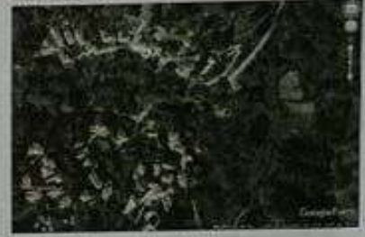
Αεροφωτογραφία Ολοκληρωθείσα Έκδοση