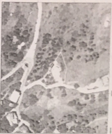
ΑΠΟΣΤΑΣΜΑ ΧΑΡΤΗΣ ΚΤΗΜΑΤΟΛΟΓΙΟΥ

ΕΜΒΑΔΑ Εγχείρ (Α01...Α13, Β01...Β09, Α01) = 844.96 τ.μ. ΕΑ = 340.27 τ.μ. ΕΒ = 504.69 τ.μ. Ε1 = 60.74 τ.μ. Ε2 = 20.56 τ.μ. Ε3 = 4.87 τ.μ. Ε4 = 43.11 τ.μ. Ε5 = 12.92 τ.μ. Ε6 = 8.27 τ.μ. Ε7 = 22.46 τ.μ.