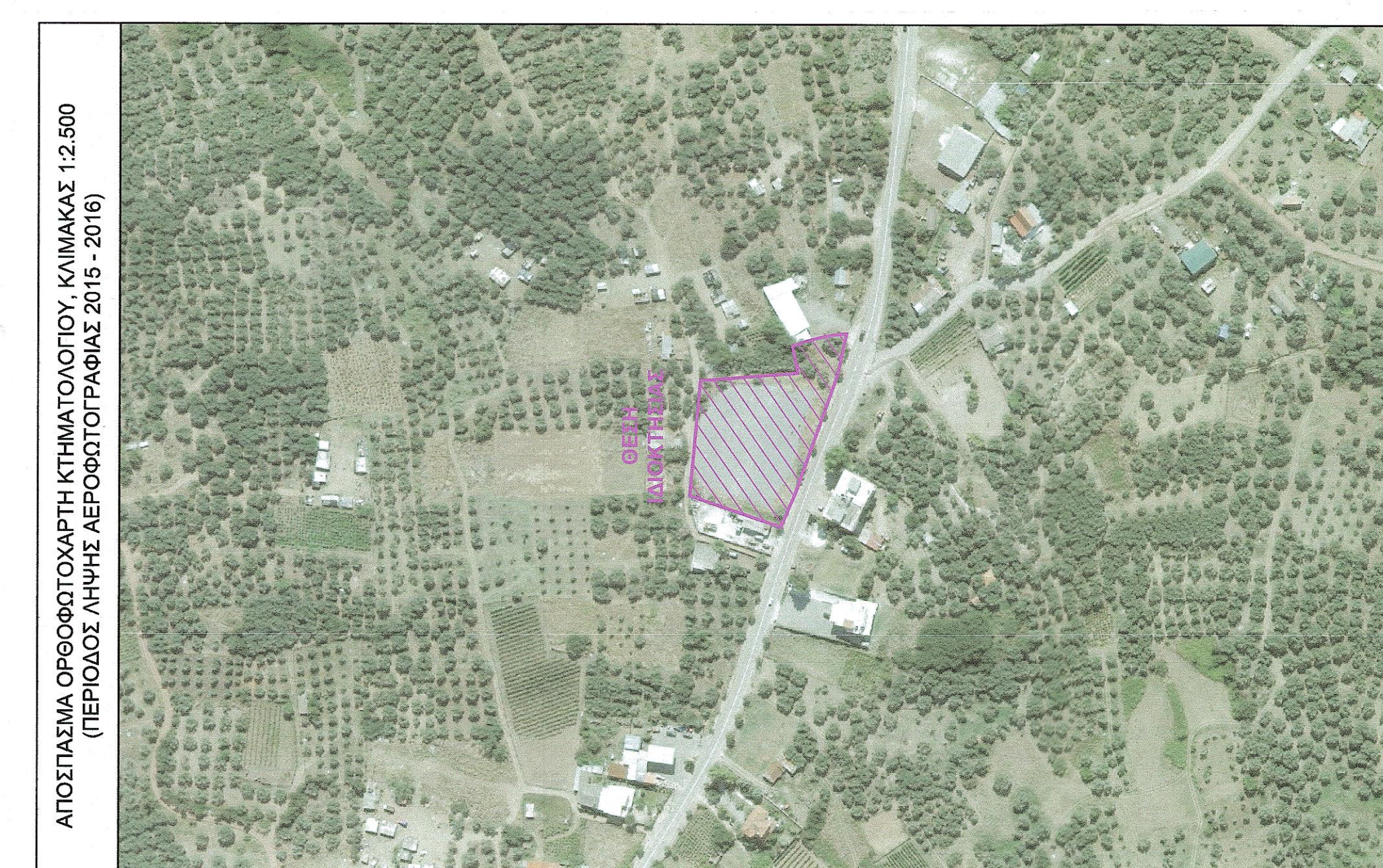
ΑΠΟΣΤΑΣΜΑ ΟΡΘΟΦΩΤΟΧΑΡΤΗ ΚΤΗΜΑΤΟΛΟΓΟΥ, ΚΑΙΜΑΚΑΣ 1:2.500 (ΠΕΡΙΟΔΟΣ ΑΙΧΜΗΣ ΑΕΡΟΦΩΤΟΓΡΑΦΙΑΣ 2015 - 2016)