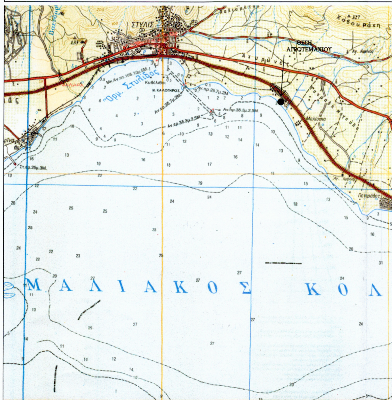
ΑΠΟΣΠΑΣΜΑ ΧΑΡΤΗ Γ.Υ.Σ. "ΠΕΛΑΣΓΙΑ" ΚΛΙΜΑΚΑ 1 : 50.000