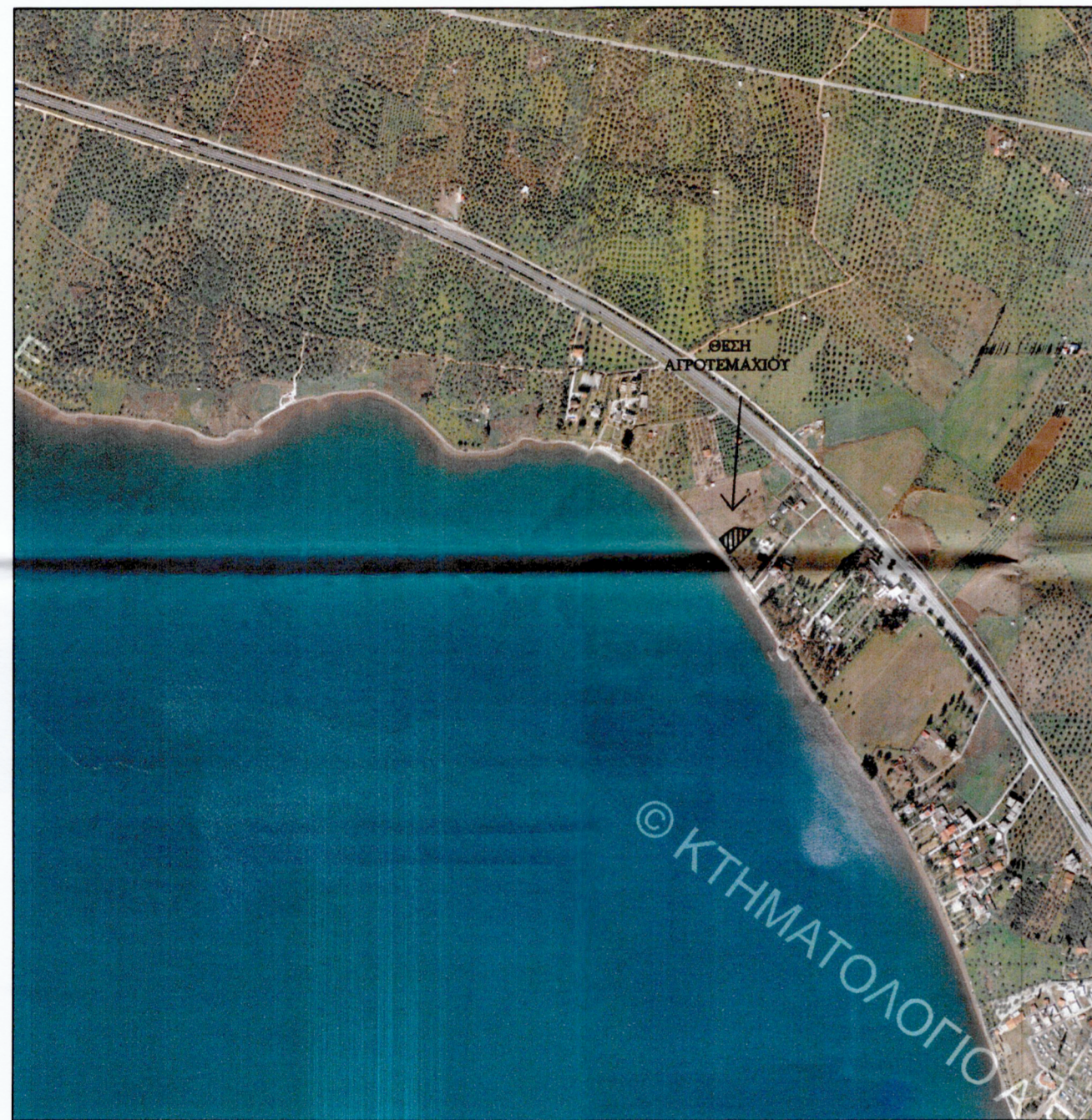
ΑΠΟΣΠΑΣΜΑ ΟΡΘΟΦΩΤΟΧΑΡΤΗ ΚΤΗΜΑΤΟΛΟΓΙΟΥ ΚΛΙΜΑΚΑ 1 : 10.000