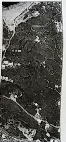
ΑΕΡΟΦΩΤΟΓΡΑΦΙΑ ΟΡΟΜΕΤΡΙΚΗΣ ΣΥΝΤΗΡΗΣΗΣ