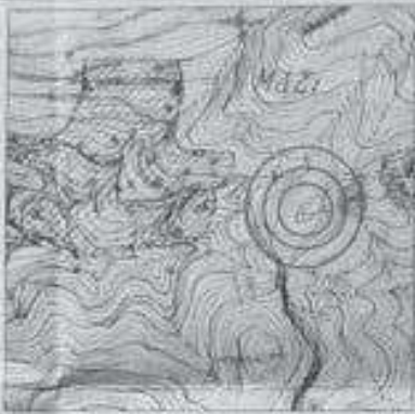
Χάρη ΥΥΣ.Α. 1:5000, φύλλο 4201 Α