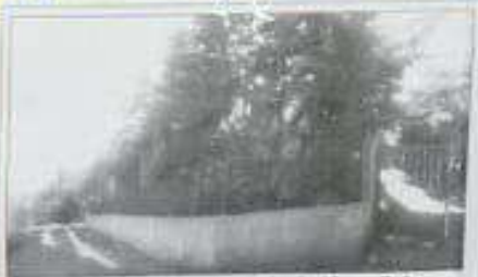
Φωτογραφία οπισθοπόρτας (Σημείο Αξίας S1)