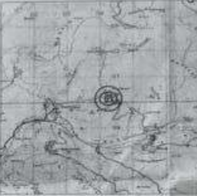
Χάρη ΥΥΣ.Α. 1:5000, φύλλο 'ΔΑΦΝΗ'

ΘΕΣΗ ΚΑΙ ΟΡΟΜΕΤΡΙΑ ΤΩΝ ΣΗΜΕΙΩΝ ΤΗΣ ΕΡΕΥΝΑΣ Οι κλίμακες αναγραφόμενες... Καλαβρύται Φεβρουάριος 2018