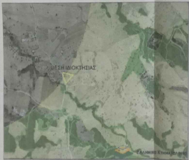
ΑΠΟΣΠΑΣΜΑ ΜΕΡΙΚΩΣ ΚΥΡΩΜΕΝΟΥ ΔΑΣΙΚΟΥ ΧΑΡΤΗ Π.Ε. ΑΧΑΪΑΣ