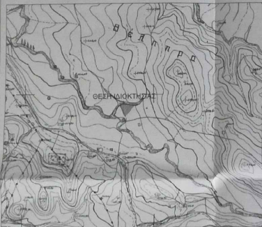
ΑΠΟΣΠΑΣΜΑ ΜΕΡΙΚΩΣ ΚΥΡΩΜΕΝΟΥ ΔΑΣΙΚΟΥ ΧΑΡΤΗ Π.Ε. ΑΧΑΪΑΣ