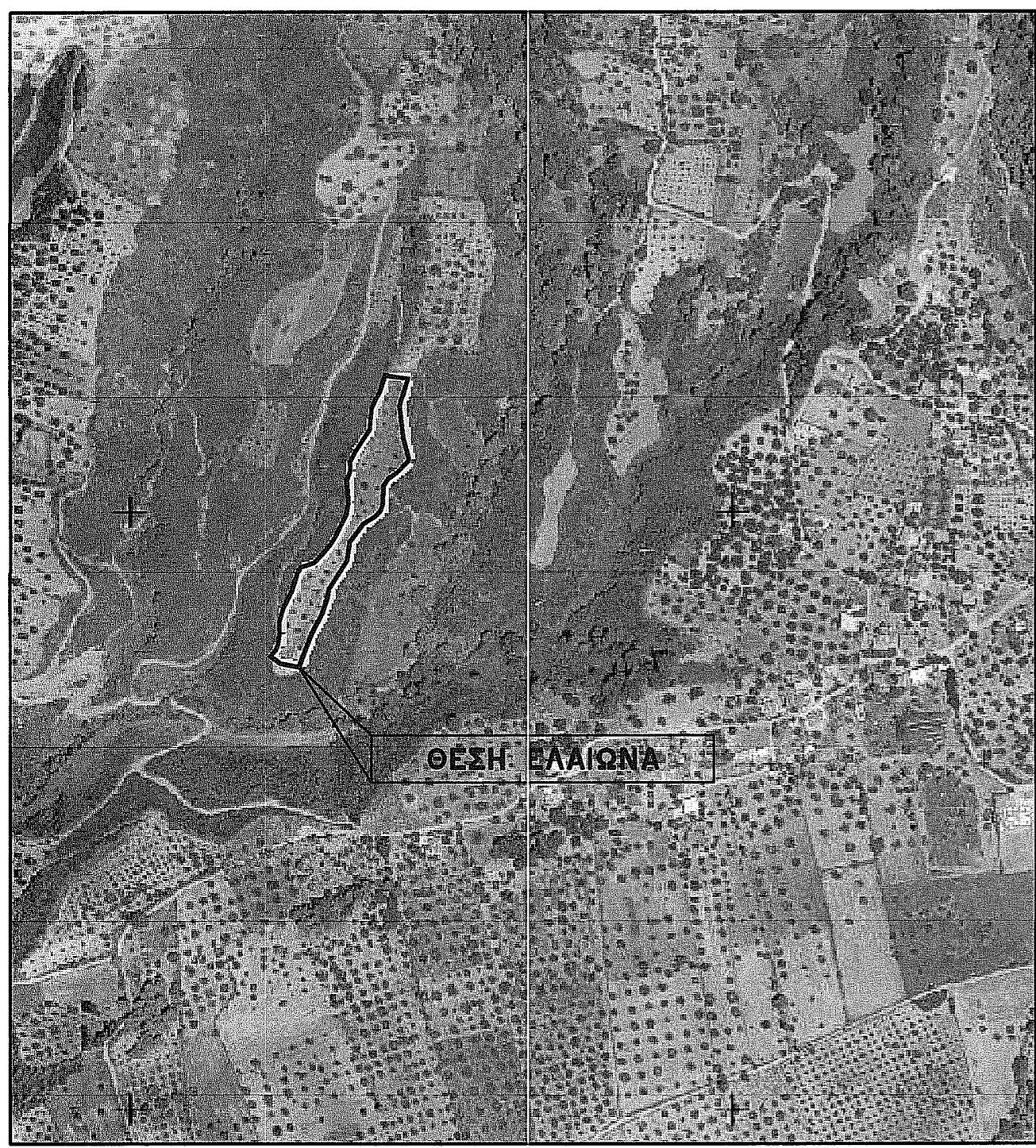
ΑΠΟΣΠΑΣΜΑ ΧΑΡΤΗ 1/50.000