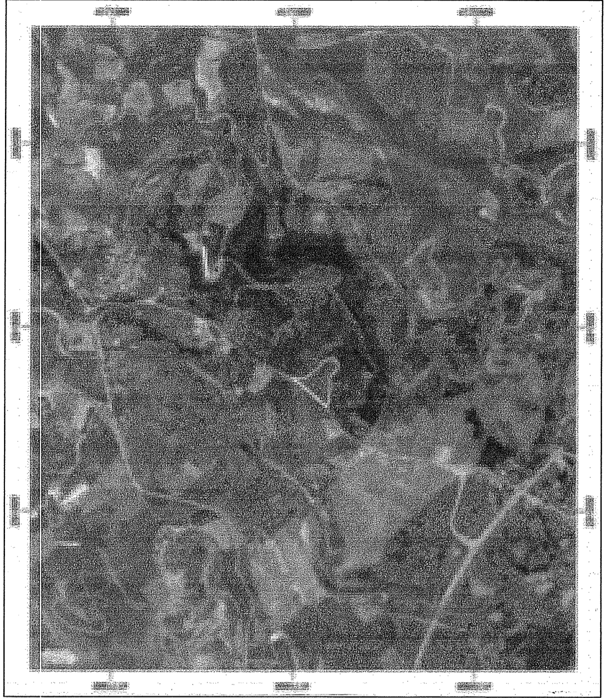
ΑΠΟΣΠΑΣΜΑ ΚΥΡΩΜΕΝΟΥ ΔΑΣΙΚΟΥ ΧΑΡΤΗ

ΒΑΣΙΛΕΙΟΣ Γ. ΖΑΧΑΡΟΠΟΥΛΟΣ ΠΟΛΙΤΙΚΟΣ ΜΗΧΑΝΙΚΟΣ Ε.Μ.Π.