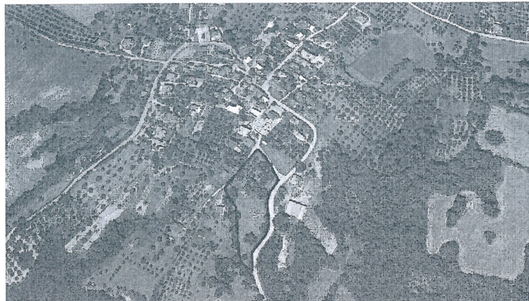
Εντοπισμός αγροτεμαχίου σε δορυφορική εικόνα GOOGLE EARTH