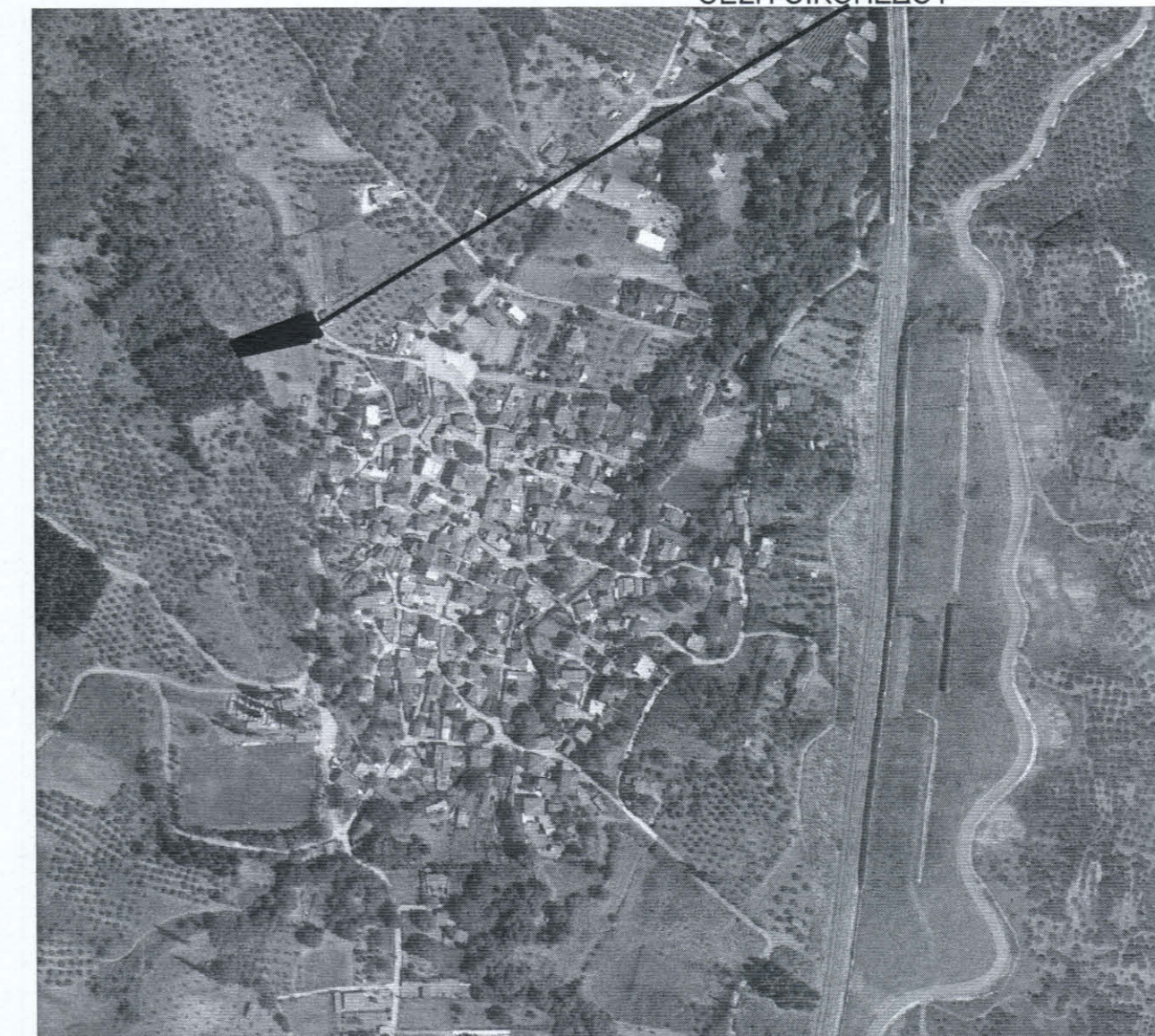
ΑΠΟΣΠΑΣΜΑ ΑΠΟ ΔΟΥΡΥΦΟΡΙΚΗ ΑΠΕΙΚΟΝΙΣΗ (ΚΛΙΜΑΚΑ 1:5000) ΘΕΣΗ ΟΙΚΟΠΕΔΟΥ

ΓΕΩΡΓΙΟΣ ΒΕΛΙΑΣ ΔΙΠΛ. ΠΟΛΙΤΙΚΟΣ ΜΗΧΑΝΙΚΟΣ ΑΡ. ΜΗΤΡΩΟΥ Τ.Ε.Ε. 104274 ΑΜΑΛΙΑΣ 1 - ΛΑΜΙΑ, ΚΙΝ. 6944737987 ΑΦΜ: 130594475 ΔΟΥ ΛΑΜΙΑΣ