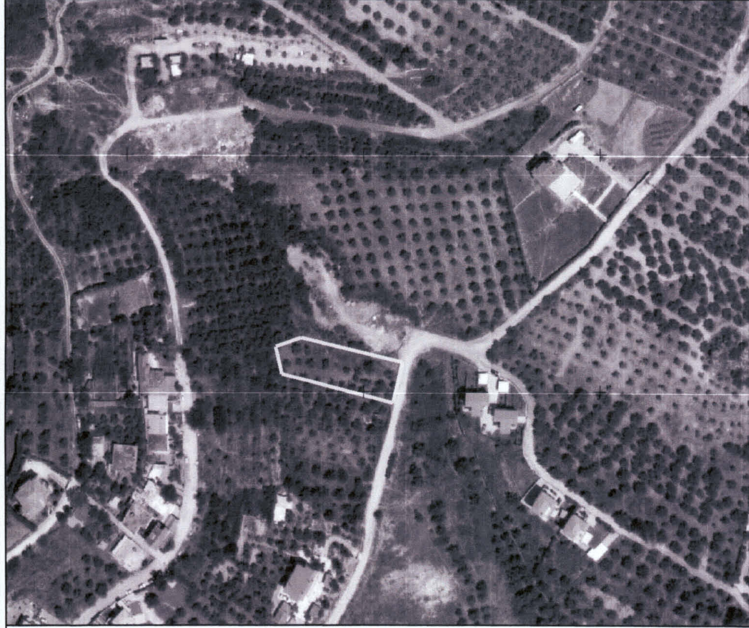
ΑΠΟΣΠΑΣΜΑ ΟΡΘΟΦΩΤΟΧΑΡΤΗ ΚΤΗΜΑΤΟΛΟΓΙΟΥ