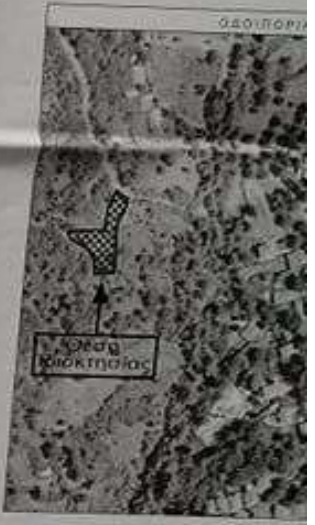
ΑΠΟΤΥΠΩΜΑ ΓΕΩΓΡΑΦΙΚΟΥ ΣΥΣΤΗΜΑΤΟΣ