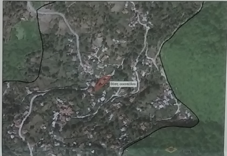
Απόσπασμα μερικώς κυρωμένου Δασικού Χάρτη (υπ' αριθ. 203771/21.12.2017 απόφ. Δ/σης Δασών Ιωαννίνων)