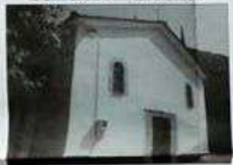
ΦΩΤΟΓΡΑΦΙΑ ΑΠΟ ΘΕΣΗ ΛΗΨΗΣ 2