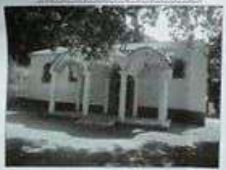
ΦΩΤΟΓΡΑΦΙΑ ΑΠΟ ΘΕΣΗ ΛΗΨΗΣ 3