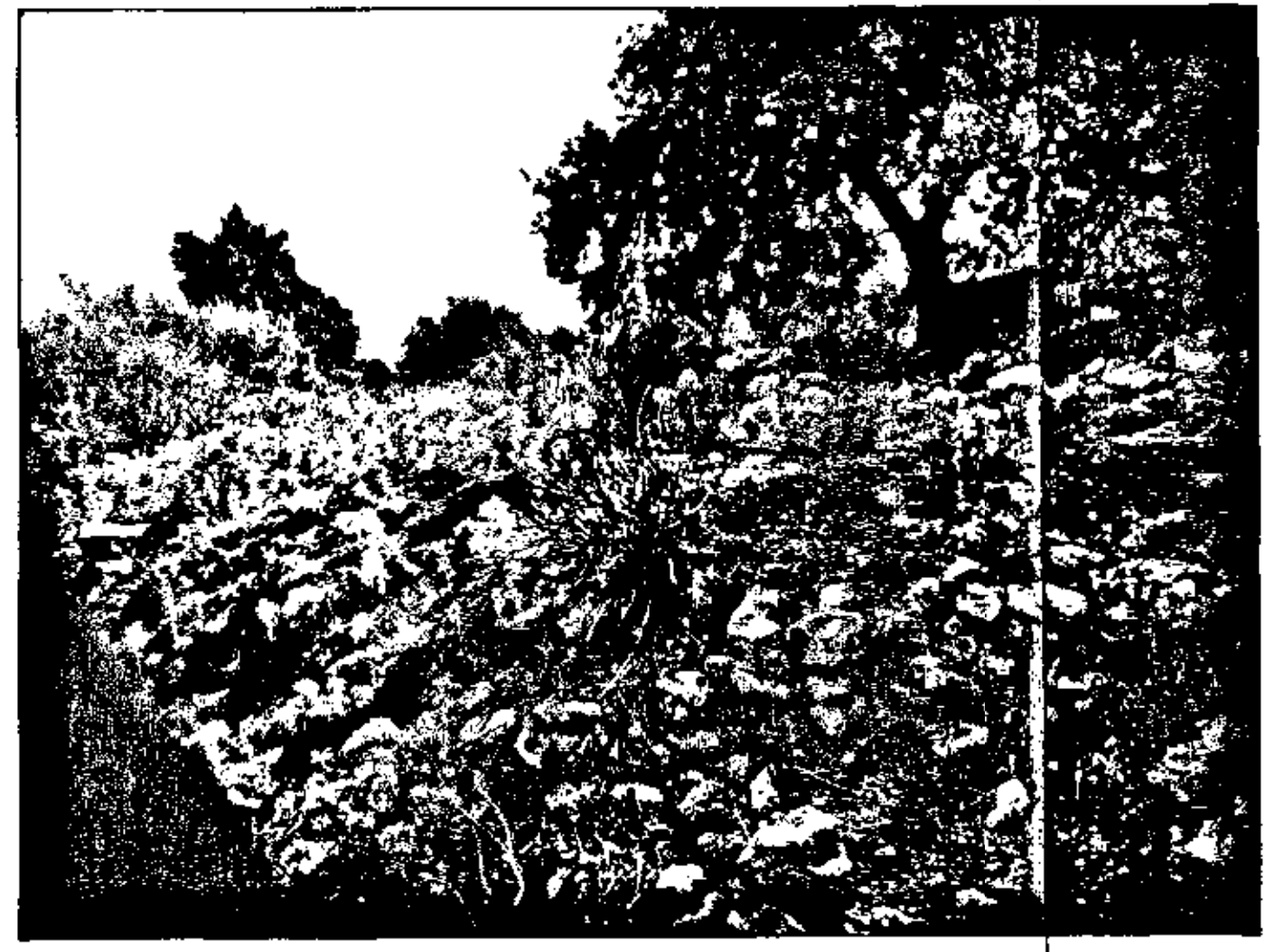
ΦΩΤΟΓΡΑΦΙΑ ΑΠΟ ΘΕΣΗ ΛΗΨΗΣ 3