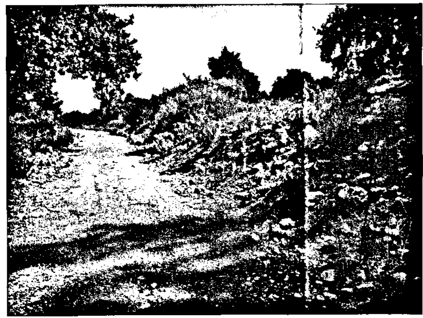
ΦΩΤΟΓΡΑΦΙΑ ΑΠΟ ΘΕΣΗ ΛΗΨΗΣ 2