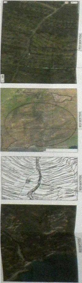
1) Αεροφωτογραφία... 2) Αεροφωτογραφία... 3) Αεροφωτογραφία... 4) Αεροφωτογραφία...