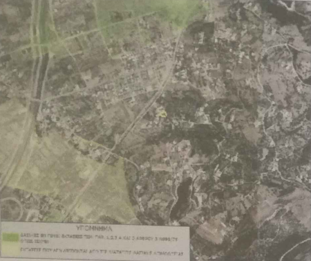
ΑΠΟΣΠΑΣΜΑ ΧΑΡΤΗ Γ.Υ.Σ. ΥΠΟΛΟΓ.Μ. 6225-8 ΚΑ.1/5000