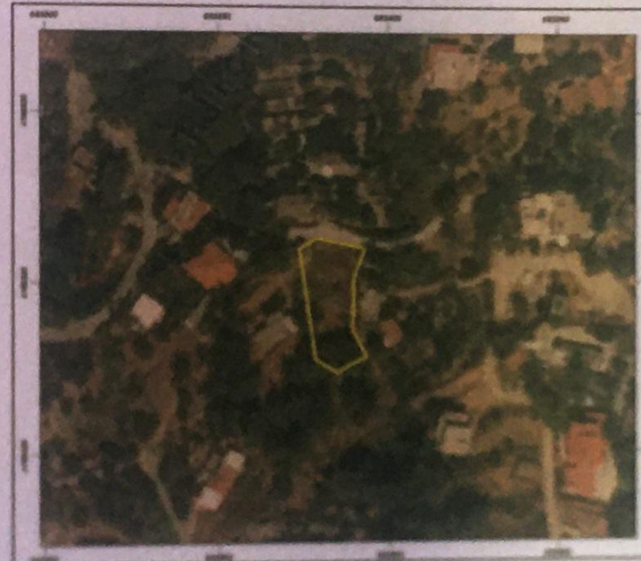
Αποσπασμα Χαρτη ΣΧΟΟΑΠ Ικαρίας