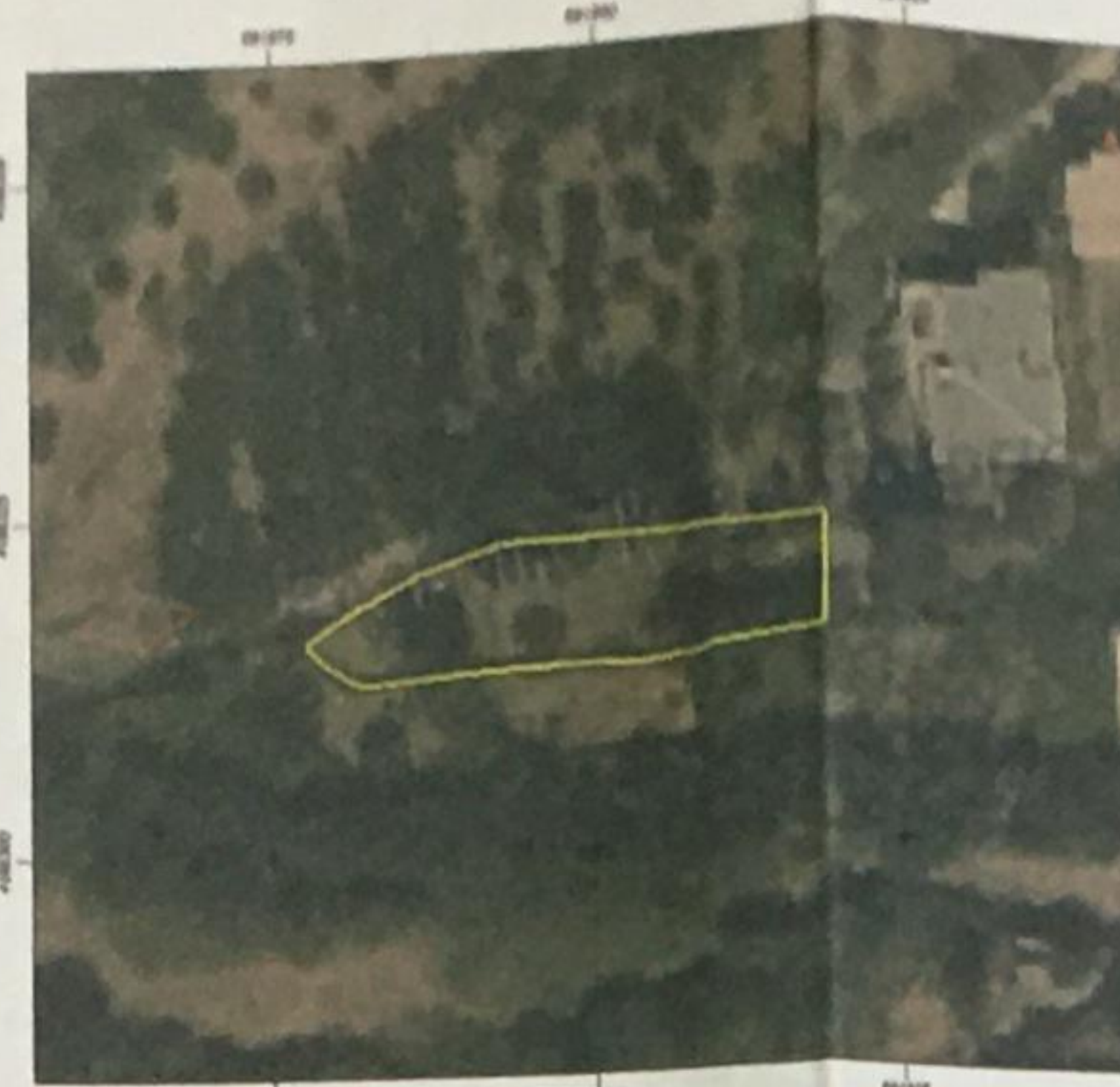
ΑΠΟΣΠΑΣΜΑ ΑΠΟ ΤΗΝ ΥΠΗΡΕΣΙΑ ΘΕΑΣΗΣ ΚΤΗΜΑΤΟΛΟΓΙΟΥ

Εμβαδόν (A1,A2,A3,A4,A5,A6,A7,A8,A9,A10, A11,A12,A13,A14,A15,A16,A1)=328.49 τ.μ.