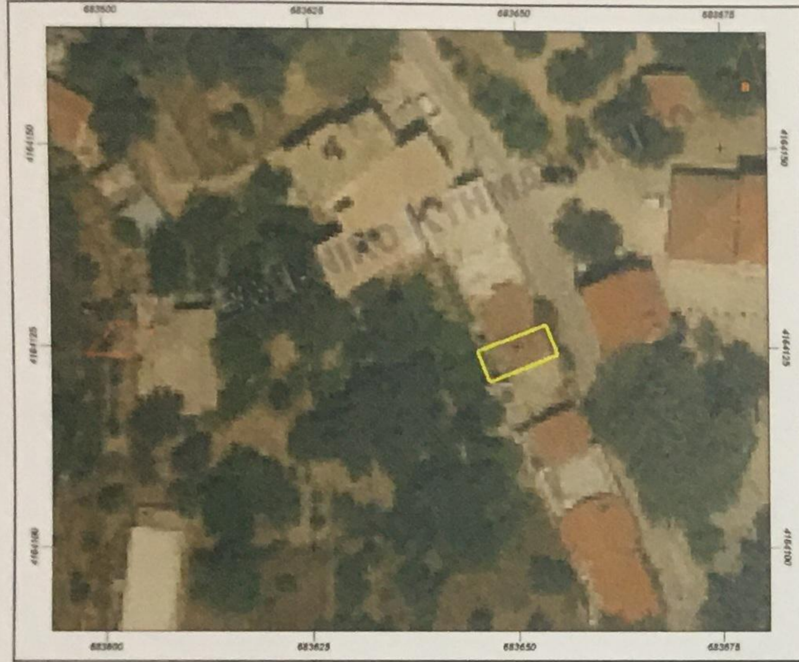
Αποσπασμα Χαρτη Κτηματολογιου