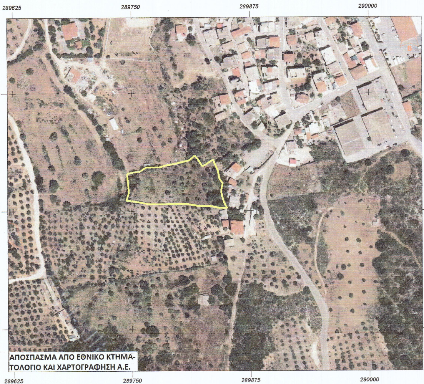
ΑΠΟΣΠΑΣΜΑ ΑΠΟ ΕΘΝΙΚΟ ΚΤΗΜΑΤΟΛΟΓΙΟ ΚΑΙ ΧΑΡΤΟΓΡΑΦΗΣΗ Α.Ε.

ΟΡΟΙ ΔΟΜΗΣΗΣ ΕΚΤΟΣ ΣΧΕΔΙΟΥ ΟΙΚΙΣΜΟΥ (Π.Δ. 24.05.1985-ΦΕΚ 270/31.05.1985 & Ν.3212/2003-ΦΕΚ 308Α/31.12.2003) ΑΡΤΙΟΤΗΤΑ ΚΑΤΑ ΚΑΝΟΝΑ: ΠΡΟΣΩΠΟ ΣΕ ΚΟΙΝΟΧΡΗΣΤΟ ΔΡΟΜΟ ΕΜΒΑΔΟΝ=4000ΤΜ, ΠΡΟΣΩΠΟ=25.00Μ ΠΡΟΣΩΠΟ ΣΕ ΔΙΕΘΝΕΙΣ, ΕΘΝΙΚΕΣ, ΕΠΑΡΧΙΑΚΕΣ, ΔΗΜΟΤΙΚΕΣ ΚΑΙ ΚΟΙΝΟΤΙΚΕΣ ΟΔΟΥΣ ΕΜΒΑΔΟΝ=4000ΤΜ, ΠΡΟΣΩΠΟ=45.00Μ, ΒΑΘΟΣ=50.00Μ ΚΑΤΑ ΠΑΡΕΚΚΛΙΣΗ: ΧΩΡΙΣ ΠΡΟΣΩΠΟ ΣΕ ΔΡΟΜΟ ΚΑΙ ΠΡΟ 31.12.2003 ΕΜΒΑΔΟΝ=4000ΤΜ ΠΡΟΣΩΠΟ ΣΕ ΔΙΕΘΝΕΙΣ, ΕΘΝΙΚΕΣ, ΕΠΑΡΧΙΑΚΕΣ, ΔΗΜΟΤΙΚΕΣ ΚΑΙ ΚΟΙΝΟΤΙΚΕΣ ΟΔΟΥΣ ΕΜΒΑΔΟΝ=2000ΤΜ, ΠΡΟΣΩΠΟ=25.00Μ, ΒΑΘΟΣ=40.00Μ (ΠΡΟ 17.10.1978) ΕΜΒΑΔΟΝ=1200ΤΜ, ΠΡΟΣΩΠΟ=20.00Μ, ΒΑΘΟΣ=35.00Μ (ΠΡΟ 12.09.1964) ΕΜΒΑΔΟΝ= 750ΤΜ, ΠΡΟΣΩΠΟ=10.00Μ, ΒΑΘΟΣ=15.00Μ (ΠΡΟ 12.11.1962) ΕΝΤΟΣ ΖΩΝΗΣ ΠΟΛΕΩΝ, ΚΩΜΩΝ ΚΑΙ ΟΙΚΙΣΜΩΝ ΚΑΙ ΠΡΟ 24.4.1977 ΕΜΒΑΔΟΝ=2000ΤΜ ΟΡΟΙ ΔΟΜΗΣΗΣ: (ΓΙΑ ΚΑΤΟΙΚΙΑ) ΣΥΝΤΕΛΕΣΤΗΣ ΔΟΜΗΣΗΣ: ΓΙΑ ΕΜΒΑΔΟΝ ΓΕΩΤΕΜΑΧΙΟΥ ΕΩΣ 4000ΤΜ Σ Δ.=0.20 & ΜΕΓΙΣΤΗ ΔΟΜΗΣΗ=200ΤΜ ΓΙΑ ΕΜΒΑΔΟΝ ΓΕΩΤΕΜΑΧΙΟΥ ΑΠΟ 4000ΤΜ ΕΩΣ 8000ΤΜ Σ Δ.=0.20 & ΜΕΓΙΣΤΗ ΔΟΜΗΣΗ= 200ΤΜ + (ΕΜΒ. ΓΕΩΤΕΜΑΧΙΟΥ-4000)Χ0.02 ΓΙΑ ΕΜΒΑΔΟΝ ΓΕΩΤΕΜΑΧΙΟΥ ΜΕΓΑΛΥΤΕΡΟ ΑΠΟ 8000 ΤΜ Σ Δ.=0.20 & ΜΕΓΙΣΤΗ ΔΟΜΗΣΗ= 280ΤΜ + (ΕΜΒ. ΓΕΩΤΕΜΑΧΙΟΥ-8000)Χ0.01 < 400ΤΜ ΥΨΟΣ ΚΤΙΣΜΑΤΟΣ: 7.5Μ (ΔΥΟ ΟΡΟΦΟΙ) ΚΑΛΥΨΗ: 10%