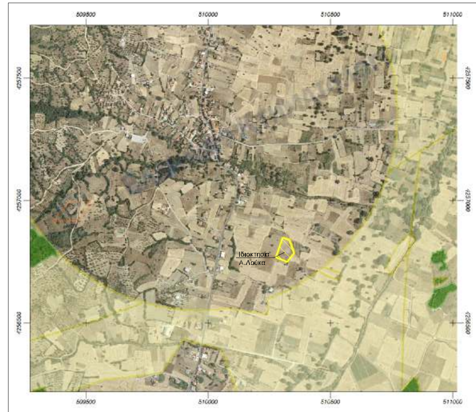
ΑΠΟΣΠΑΣΜΑ ΔΑΣΙΚΟΥ ΧΑΡ ΤΗ Ε.Κ.Χ.Α.