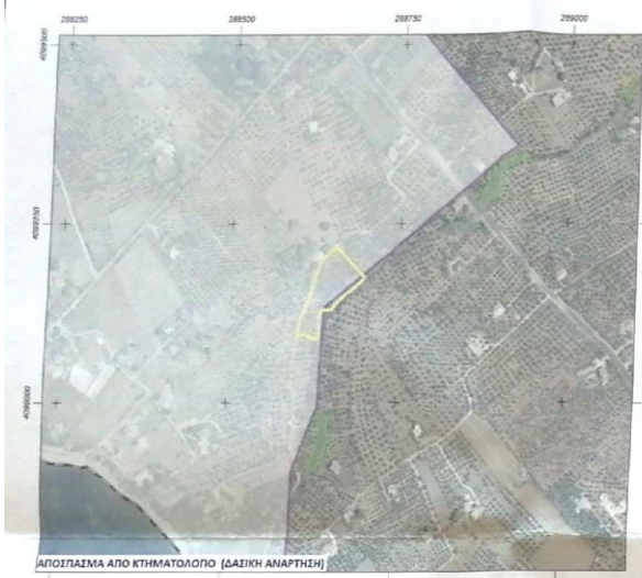
ΑΠΟΪΓΡΑΜΜΑ ΑΠΟ ΚΤΗΜΑΤΟΛΟΓΙΟ (ΔΑΣΙΚΗ ΑΝΑΡΤΗΣΗ)

ΟΡΟΙ ΔΟΜΗΣΗΣ (για κατοικία) Σύμφωνα με το Π.Δ. 24-5-1985 ΦΕΚ 270 Δ / 31-5-1985, συνδυαστικά με το άρθρο 10 του Ν. 3212-2003 ΦΕΚ 308 Α / 31-12-2003 και τα άρθρα 32 και 33 του Ν. 4759-2020 ΦΕΚ 245 Α / 9-12-2020. ΑΡΤΙΟΤΗΤΑ: 4000μ2 και πρόσωπο 25μ σε κοινόχρηστο δρόμο. (κανόνας) 4000μ2 προ της 31-12-2003 (παρέκλιση) ΚΑΛΥΨΗ: 10% ΔΟΜΗΣΗ: α) Για γήπεδα εμβαδού μεγαλύτερου των 4000μ2 και μέχρι 8000μ2, για μεν τα πρώτα 4000μ2 186μ2, για δε τα λοιπά το γυνόμενο του υπολοίπου εμβαδού του γηπέδου επί του συντελεστή δόμησης 0,018 β) Για γήπεδα εμβαδού μεγαλύτερου των 8000μ2, για μεν τα πρώτα 8000μ2 258μ2, για δε τα λοιπά το γυνόμενο του υπολοίπου εμβαδού του γηπέδου επί του συντελεστή δόμησης 0,009 μη δυναμεί να σε κλίμα περίπτωση να υπερβεί τα 360μ2. ΑΡΙΘΜΟΣ ΟΡΟΦΩΝ: 2 ΜΕΠΙΣΤΟ ΥΨΟΣ: 7,50μ συν 1,20μ για κατασκευή στέγης ΠΛΑΤΕΙΑ ΑΠΟΤΑΞΕΙΣ: 15μ.