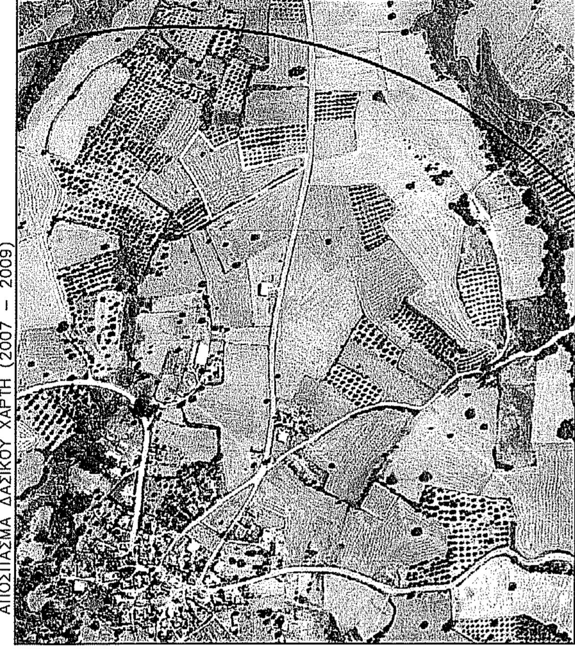
Η ΙΔΙΟΚΤΗΣΙΑ ΦΑΙΝΕΤΑΙ ΜΕ ΚΙΡΠΙΝΗ ΓΡΑΜΜΗ