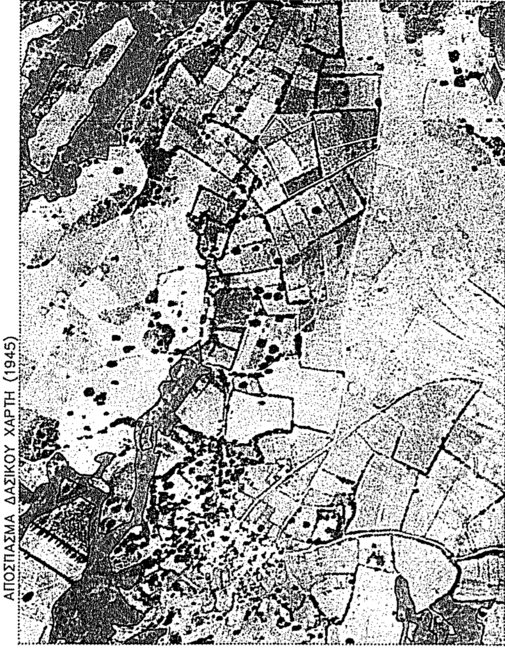
Η ΙΔΙΟΚΤΗΣΙΑ ΦΑΙΝΕΤΑΙ ΜΕ ΚΙΡΠΙΝΗ ΓΡΑΜΜΗ

ΤΟΠΟΓΡΑΦΙΚΟ ΔΙΑΓΡΑΜΜΑ ΓΗΠΕΔΟΥ ΥΠΟ ΤΑ ΣΤΟΙΧΕΙΑ (1-2-3-4-5-6-7-8-9-10-11-12-13-14-15-16-17-18-19-20-1) ΙΔΙΟΚΤΗΣΙΑΣ ΜΑΡΙΑΣ ΓΟΥΡΜΟΥ ΤΟΥ ΧΡΗΣΤΟΥ ΕΥΡΙΣΚΟΜΕΝΟΥ ΣΤΗ ΘΕΣΗ "ΑΜΠΕΛΙΑ" ΤΗΣ ΑΓΡΟΤΙΚΗΣ ΠΕΡΙΦΕΡΕΙΑΣ ΤΟΥ ΟΙΚΙΣΜΟΥ ΔΑΦΝΗΣ ΤΗΣ Τ.Κ ΑΕΤΟΡΑΧΗΣ ΤΟΥ ΔΗΜΟΥ ΑΝΔΡΑΒΙΔΑΣ ΚΥΛΛΗΝΗΣ.