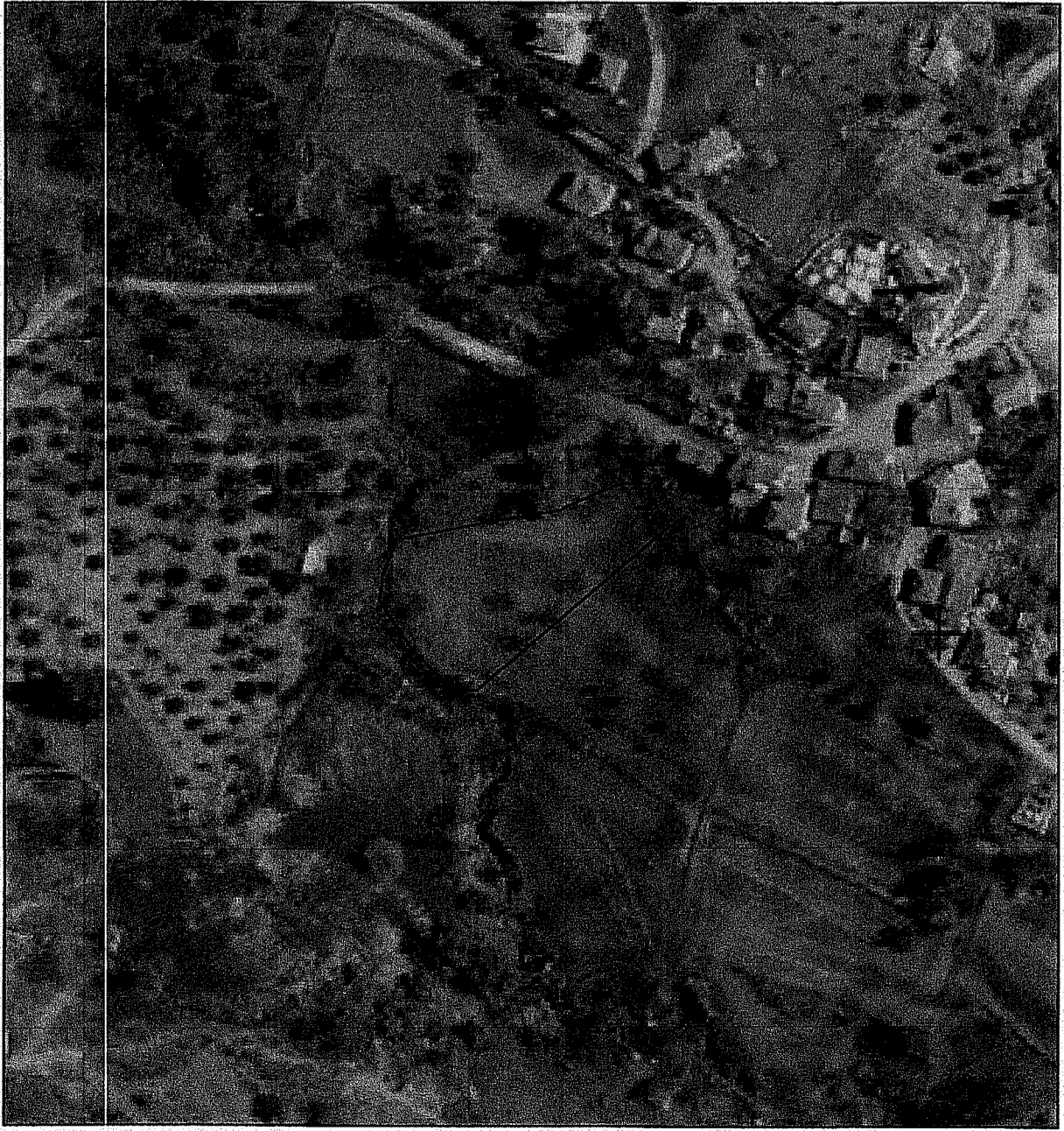
εντοπισμός της έκτασης σε αεροφωτογραφία του Κτηματολογίου