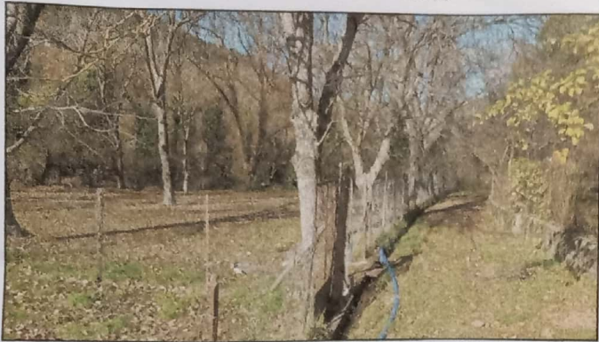
ΦΩΤΟΓΡΑΦΙΑ ΑΠΟ ΘΕΣΗ ΛΗΨΗΣ (1)