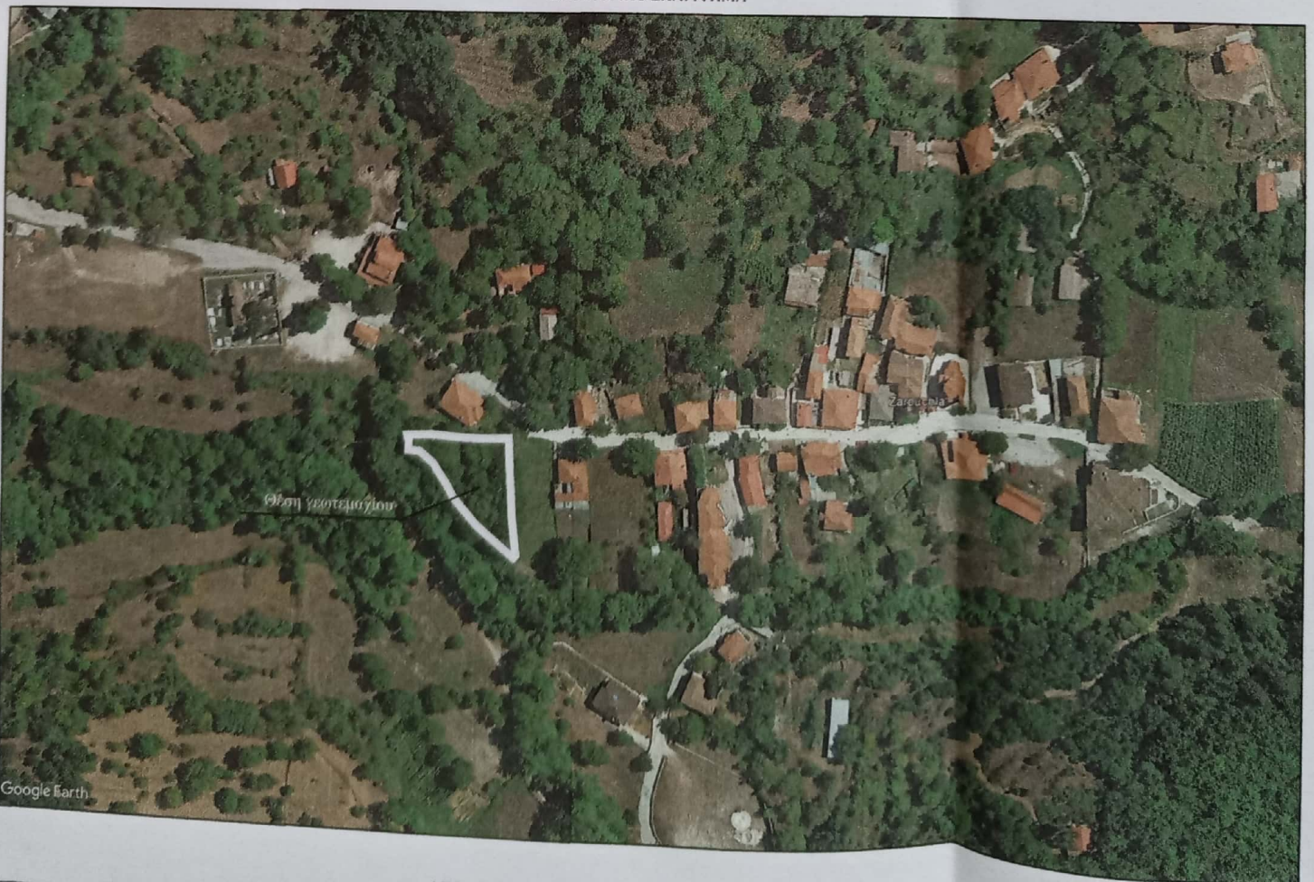
ΑΠΟΣΠΑΣΜΑ ΧΑΡΤΗ ΟΙΚΙΣΜΟΥ ΖΑΡΟΥΧΛΑΣ