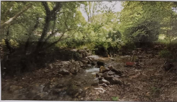
ΦΩΤΟΓΡΑΦΙΑ ΑΠΟ ΘΕΣΗ ΛΗΨΗΣ (3)