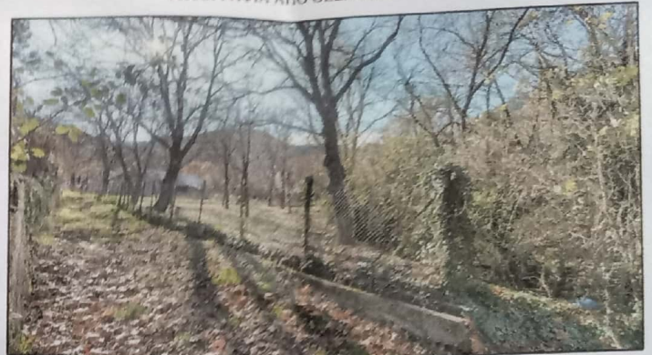
ΦΩΤΟΓΡΑΦΙΑ ΑΠΟ ΘΕΣΗ ΛΗΨΗΣ (2)