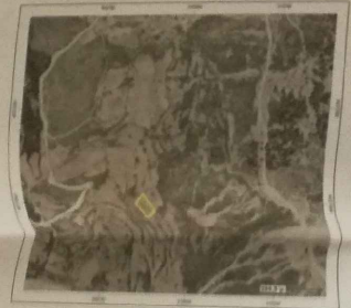
ΑΠΟΣΠΑΣΜΑ ΧΑΡΤΟΥ Γ.Υ.Σ.

ΠΑΝΑΓΙΩΤΗΣ Γ. ΤΖΟΛΑΣ ΔΙΠΛΩΜΑΤΙΣΤΗΣ ΠΟΛΙΤΙΚΟΣ ΜΗΧΑΝΙΚΟΣ ΠΛΗΡΗΣ ΕΚΠΟΡΕΥΣΗΣ ΤΙΜΩΝ ΚΑΤΩΤΕΡΗΣ ΜΕΛΕΤΗΣ Ε. Α. Π. ΑΡΧΙΤΕΚΤΟΝΙΚΩΝ ΕΡΓΩΝ ΓΟΥΝΑΡΗ 155 & ΜΠΟΥΚΑΔΟΥΡΗ ΠΑΤΡΑ ΤΗΛ. 2610-6 22657