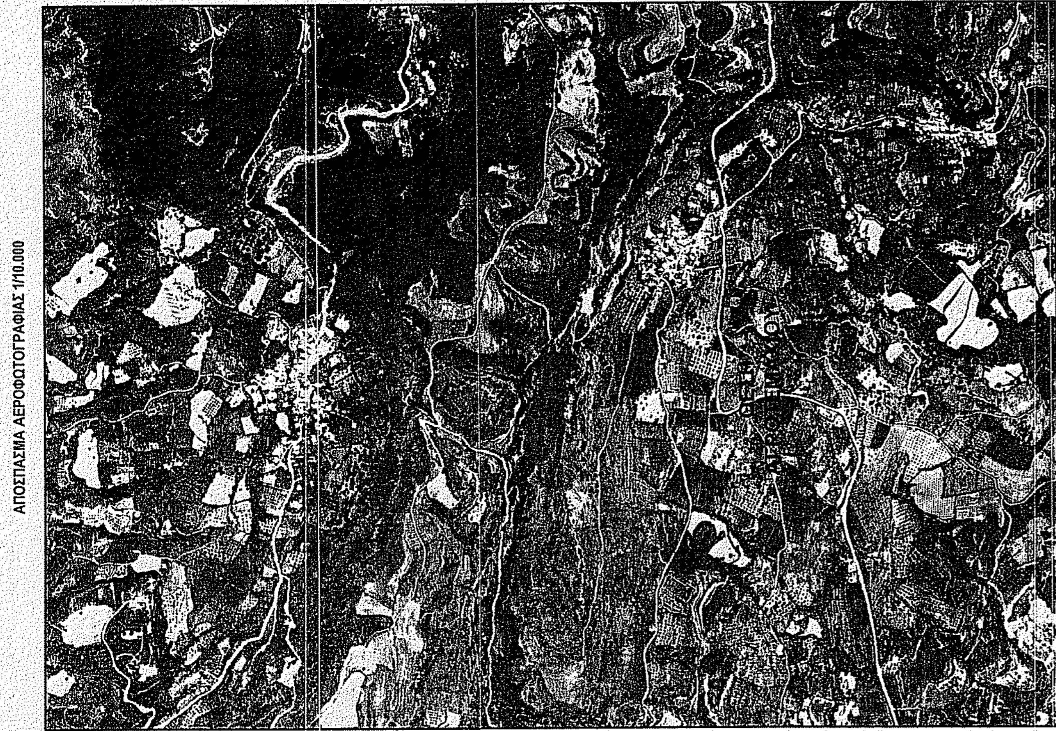
ΑΠΟΣΤΑΣΙΑ ΑΕΡΟΦΩΤΟΓΡΑΦΙΑΣ: 110.000