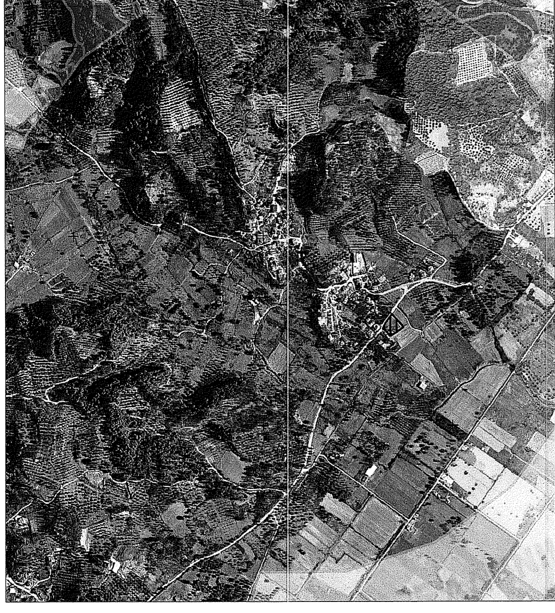
ΕΝΤΟΠΙΣΜΟΣ ΤΗΣ ΙΔΙΟΚΤΗΣΙΑΣ ΣΕ ΑΠΟΣΤΑΣΜΑ ΤΟΥ ΚΥΡΩΜΕΝΟΥ ΔΑΣΙΚΟΥ ΧΑΡΤΗ ΣΕ ΚΑΙΜΑΚΑ 1:10.000