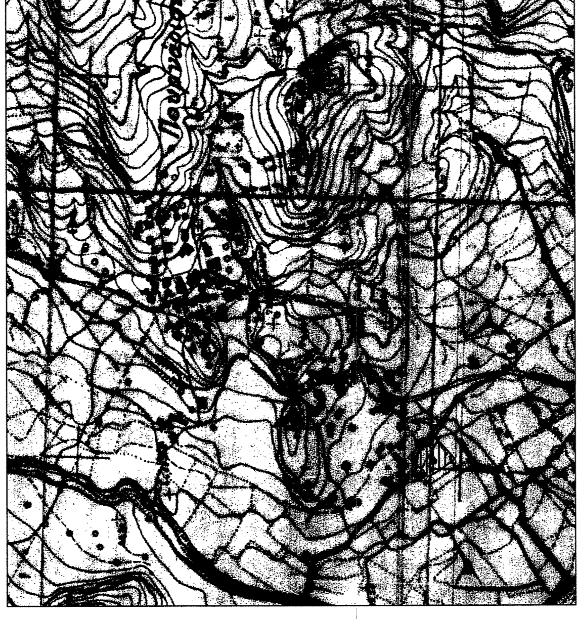
ΕΝΤΟΠΙΣΜΟΣ ΤΗΣ ΙΔΙΟΚΤΗΣΙΑΣ ΣΕ ΑΠΟΣΤΑΣΜΑ ΧΑΡΤΗ ΤΕΛΙΟΥ ΣΕ ΚΑΙΜΑΚΑ 1:5000