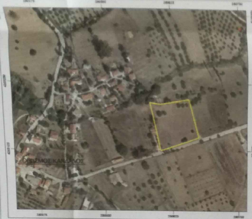
ΑΠΟΣΠΑΣΜΑ ΟΡΘΟΦΩΤΟΓΡΑΦΙΑΣ ΚΤΗΜΑΤΟΛΟΓΟΥ ΜΕ ΤΗΝ ΘΕΣΗ ΤΟΥ ΓΗΠΕΔΟΥ

ΕΜΒΛΑΝΟ ΓΗΠΕΔΟΥ (1-2-3-4-5-6-7-8-9-10-11-12-13) Ε= 5977,481 μ.²