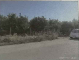
ΦΩΤΟΓΡΑΦΙΑ ΑΠΟ ΘΕΣΗ ΑΛΗΘΕΙΑ 3