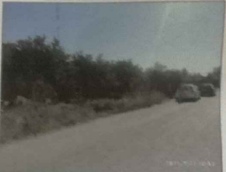
ΦΩΤΟΓΡΑΦΙΑ ΑΠΟ ΘΕΣΗ ΑΛΗΘΕΙΑ 2