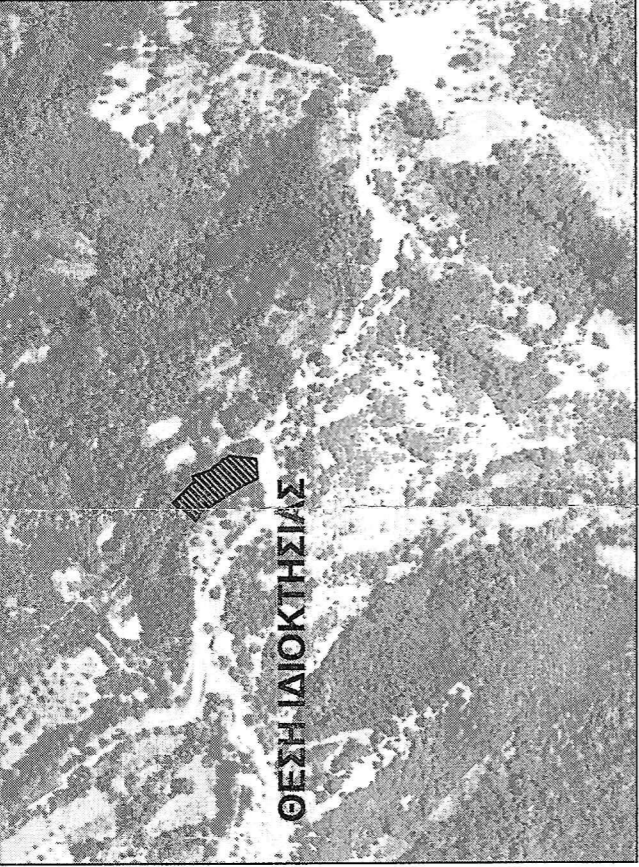
Απόσταση Ορθοφωτογραφίας ΕΚΧΑ Ευρύτερης Περιοχής Κλίμακα 1:50000

ΘΕΣΗ ΙΔΙΟΚΤΗΣΙΑΣ ΠΡΟΣ ΔΙΑΜΟΝΗ Π.Δ. 24/73-5-185(6) Ε.Σ.Κ. 27007 ΕΛΛΗΝΙΚΗ ΔΗΜΟΚΡΑΤΙΑ ΥΠΟΥΡΓΕΙΟ ΠΕΡΙΒΑΛΛΟΝΤΟΣ, ΚΕΚΕΡΤΕΙΑΣ ΚΑΙ ΑΝΤΙΠΟΛΙΤΕΥΜΑΤΟΣ ΔΙΕΥΘΥΝΣΗ ΔΕΛΤΑ ΔΕΛΤΑ ΔΕΛΤΑ ΔΕΛΤΑ ΔΙΕΥΘΥΝΣΗ ΔΕΛΤΑ ΔΕΛΤΑ ΔΕΛΤΑ ΔΕΛΤΑ ΔΙΕΥΘΥΝΣΗ ΔΕΛΤΑ ΔΕΛΤΑ ΔΕΛΤΑ ΔΕΛΤΑ ΑΝΑΡΤΗΣΗ ΚΑΤΑΡΤΙΣΤΗΡΙΟΥ ΚΤΙΣΜΑΤΟΣ ΑΝΑΡΤΗΣΗ ΚΑΤΑΡΤΙΣΤΗΡΙΟΥ ΚΤΙΣΜΑΤΟΣ ΑΝΑΡΤΗΣΗ ΚΑΤΑΡΤΙΣΤΗΡΙΟΥ ΚΤΙΣΜΑΤΟΣ ΑΝΑΡΤΗΣΗ ΚΑΤΑΡΤΙΣΤΗΡΙΟΥ ΚΤΙΣΜΑΤΟΣ ΑΝΑΡΤΗΣΗ ΚΑΤΑΡΤΙΣΤΗΡΙΟΥ ΚΤΙΣΜΑΤΟΣ ΑΝΑΡΤΗΣΗ ΚΑΤΑΡΤΙΣΤΗΡΙΟΥ ΚΤΙΣΜΑΤΟΣ ΑΝΑΡΤΗΣΗ ΚΑΤΑΡΤΙΣΤΗΡΙΟΥ ΚΤΙΣΜΑΤΟΣ ΑΝΑΡΤΗΣΗ ΚΑΤΑΡΤΙΣΤΗΡΙΟΥ ΚΤΙΣΜΑΤΟΣ