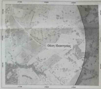
Απόσταση Αναρτημένου Δασικού Χάρτη Π.Ε. Αχαΐας