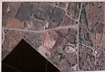
απόσπασμα χάρτη ΓΥΣ - αρ. χάρτη 9709 - 5 κλίμακα 1:5000