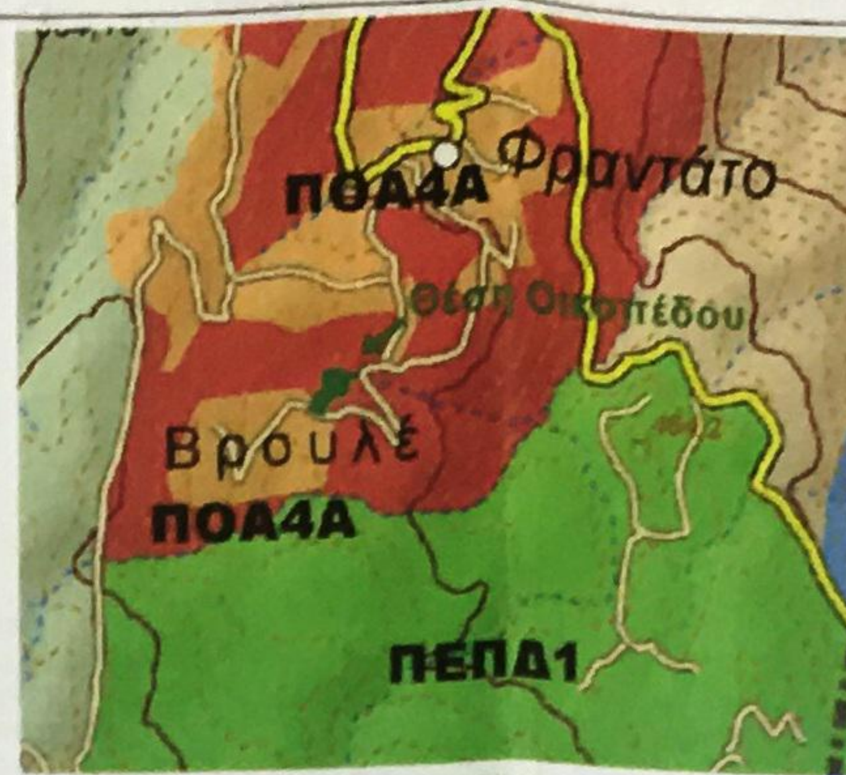
ΑΠΟΣΤΑΣΜΑ ΑΠΟ ΧΑΡΤΗ ΣΧΟΟΑΠ ΙΚΑΡΙΑΣ ΦΕΚ 198/ΑΑΓ/04-06-2013

ΣΤΟΙΧΕΙΑ ΟΙΚΟΠΕΔΟΥ Σύμφωνα με το ΦΕΚ 198/ΑΑΓ/04-06-2013 (ΣΧΟΟΑΠ) το οικόπεδο βρίσκεται εν μέρει εντός προτεινόμενων ορίων οικισμού ΠΟΑ4Α Βρούλε (448.27 τ.μ.) και εν μέρει εντός της περιοχής ελέγχου και περιορισμού δόμησης ΠΕΠΔ5 ή "Περιοχή Ήπιας Τουριστικής Ανάπτυξης" (3661.64 τ.μ.)