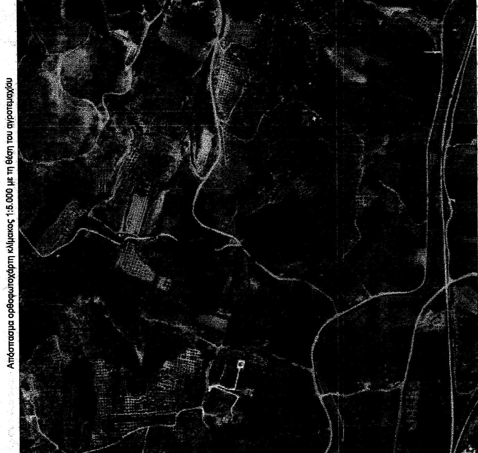
Απόσταση ορθοφωτογράμμου κλίμακας 1:5.000 με τη θέση του αγροτεμαχίου

8.- ΔΗΛΩΣΗ Ν.651/1977: 8.1.- Το αγροτέμαχο με στοιχεία (1,2,3,4,5,6,7,8,9,10,11,12,13,14,15,16,17,18,19,20,21,22,23,24,25,26,27,28,1) και εμβαδό Ε=2.854 τ.μ. βρίσκεται στην αγροτική περιοχή της Τοπικής κοινότητας Σαλαμώνης του Δήμου Πύργου, περιφερειακής ενότητας Ηλείας, στη θέση "Βουραλάκια", εκτός σχεδίου, εκτός οικισμού, εκτός οδού και είναι μη όφιο και μη οικοδομήσιμο σύμφωνα με τις ισχύουσες πολεοδομικές διατάξεις.