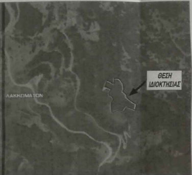
ΑΠΟΠΑΣΜΑ ΟΡΘΟΓΩΝΙΑΡΤΗ ΚΤΗΜΑΤΟΛΟΓΟΥ