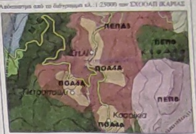
Αξιοποίηση θέσης, Κτηματολογίου κ.λ. 1-250