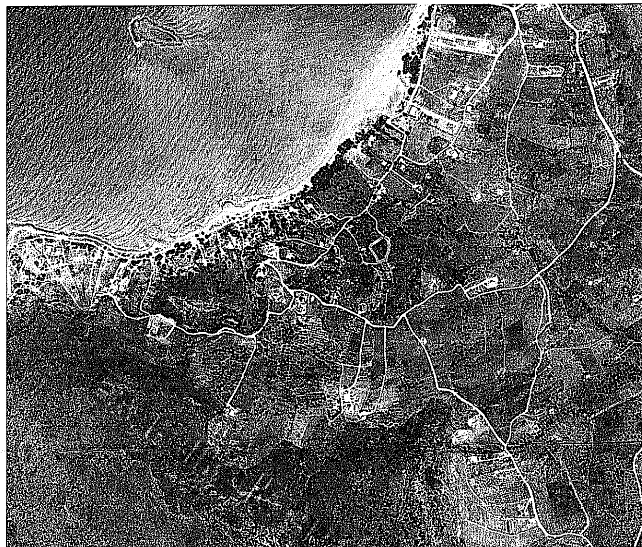
Οδοπορικό σκαρίφημα (απόσπασμα κτηματολογίου)