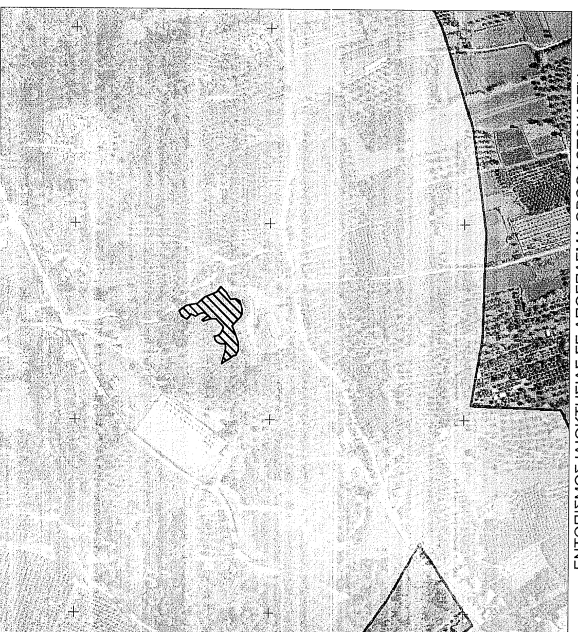
ΕΝΤΟΠΙΣΜΟΣ ΙΔΙΟΚΗΣΙΑΣ ΣΕ ΑΠΟΣΤΑΣΜΑ ΟΡΘΟΦΩΤΟΧΑΡΤΗ Κλίμακα: 1:5.000