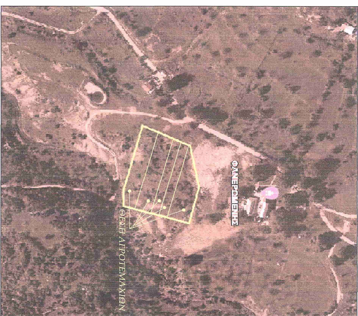
ΑΠΟΠΤΑΣΜΑ ΟΡΘΟΦΩΤΟΓΡΑΦΙΑΣ ΚΤΗΝΙΑΤΡΟΛΟΓΙΟΥ ΚΑΙΜΑΚΑ 1/2500

Οι κτηνίατροι υπεύθυνοι, έκδοσης των απαιτούμενων δεδομένων πιστοποιήσεων σχετικά με την υγιεινή της τροφής και της υγιεινής διατήρησης και υγιεινής στο κτήριο του κτηνίατρο. Οι διόκτες: