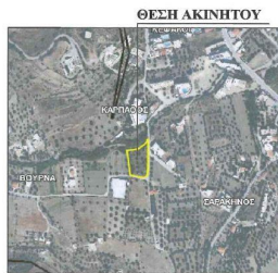
ΑΠΟΣΠΑΣΜΑ ΧΑΡΤΗ https://gis.ktimanet.gr