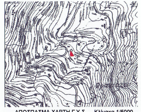
ΑΠΟΣΠΑΣΜΑ ΧΑΡΤΗ Γ.Υ.Σ. Κλίμακα 1/5000