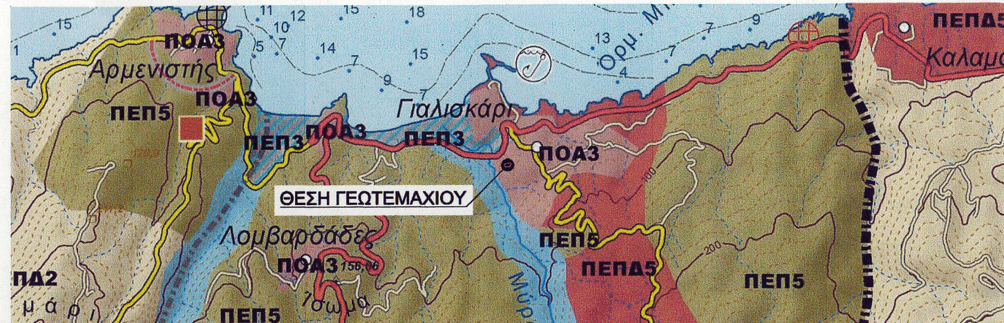
ΑΠΟΣΠΑΣΜΑ ΧΑΡΤΗ ΧΡΗΣΕΩΝ ΓΗΣ Δ.Ε. ΡΑΧΩΝ [ 15369/451/Φ.ΣΧΟΟΑΠ - ΦΕΚ 198Α.ΑΠ/2013 ] - ΚΛΙΜΑΚΑ 1:25000